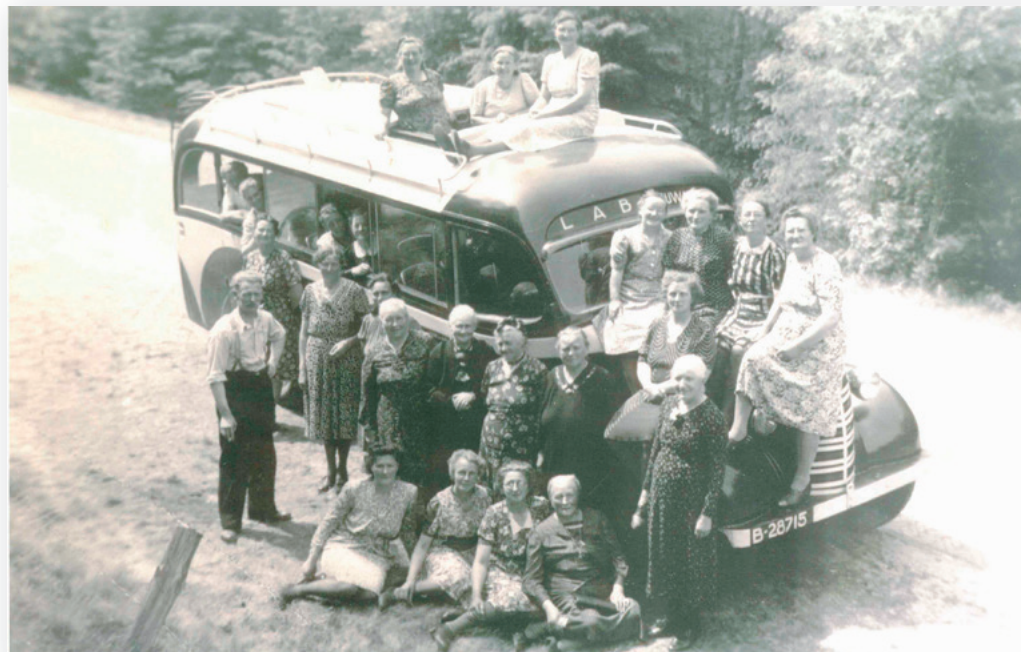
It 'Leeuwarder Auto Bedrijf' (LAB) yn 1945, foto út de kolleksje fan Tresoar.